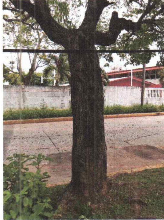
Imagen.- Árbol de la especie Guayacan, presenta daños en su parte media del tronco.